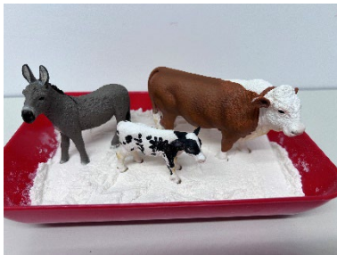
Abbildung 1: Tiere mit unterschiedlichem Gewicht