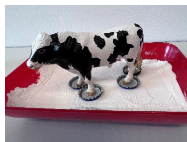
Abbildung 3: Schneeschuhe aus Kronkorken