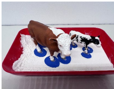
Abbildung 2: Tiere mit Schneeschuhen aus Moosgummi