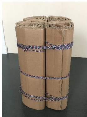
Abbildung 2: Hocker aus Karton (Forscherstation)