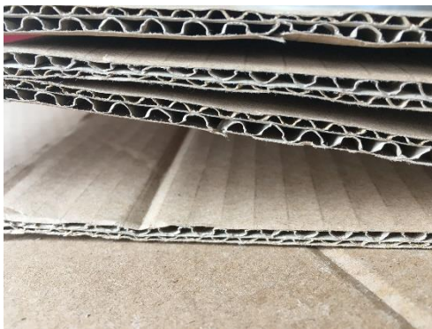
Abbildung 1: Blick in den Karton (Forscherstation)

Kinder können dabei erfahren , was den Karton so stabil macht, sie können das Material genauer untersuchen und ausprobieren , wie sie daraus einen stabilen Hocker bauen können.