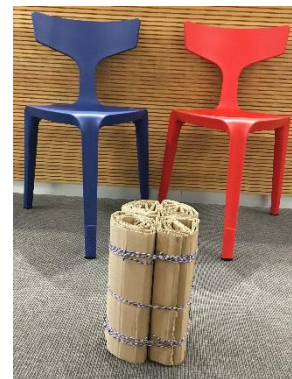
Abbildung 3: Sitzgruppe (Forscherstation)