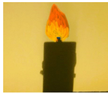
Abbildung 4: fertige Weihnachtskarte (Forscherstation)